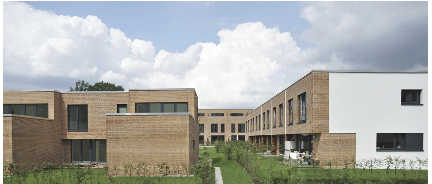
Blick vom Erna-Stahl-Ring