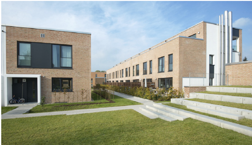
Grüne Mitte mit Sitzterrassen - Blick nach Westen