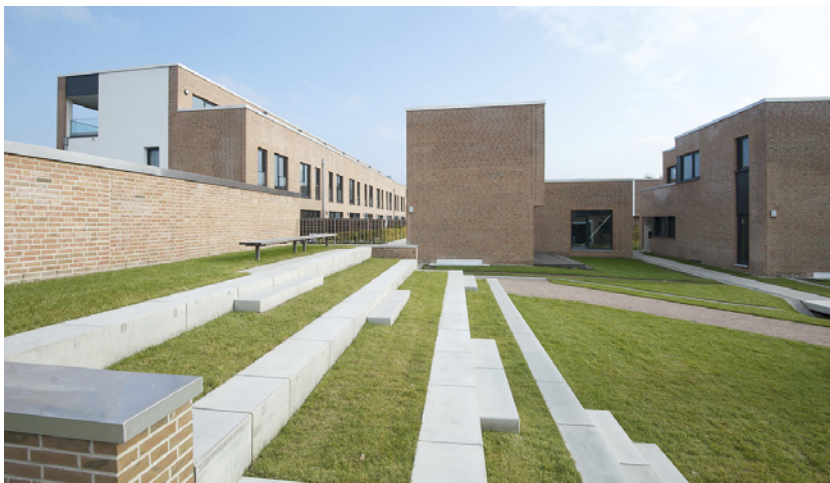
Grüne Mitte mit Sitzterrassen - Blick nach Westen