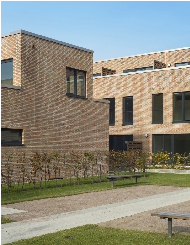
Patiohäuser, Stadthäuser und Quartiersplatz