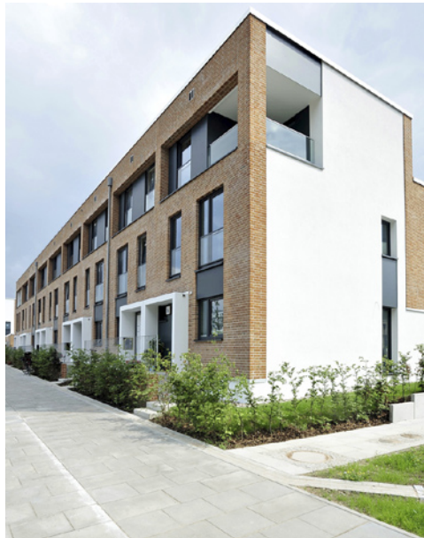
Blick vom Sodenkamp